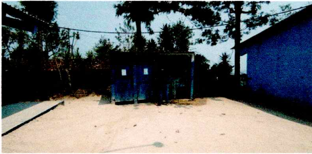
Foto3: REPARACION DE MODULOS DE BAÑOS