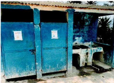
Foto: 5 REPARACION DE PUERTAS