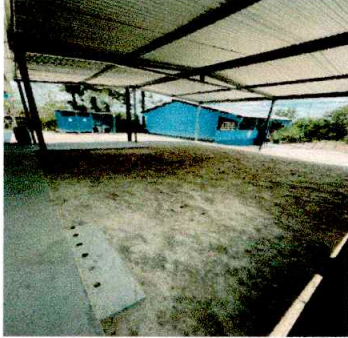
Foto1: REPARACION DE AULA