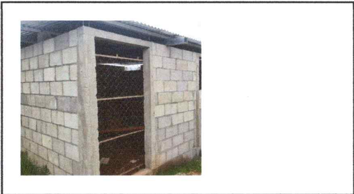
Foto1: Puerta en mal estado