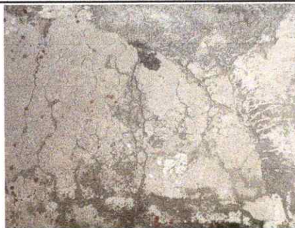
Foto 4: SUSTITUCION PISO DE CEMENTO (BASE, FUNDICION MAS ACABADO)