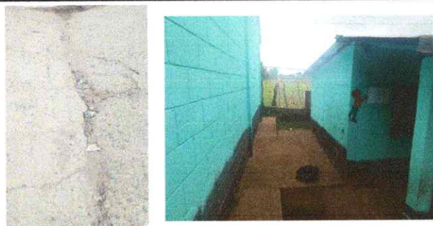
Foto 5 Y 6: SUSTITUCION CUNETA DE CONCRETO TIPO BADEN INCLUYE BASE, FUNDICION Y ACABADO FINAL, SUSTITUCION DE PINTURA BASE AGUA Y DE ACEITE