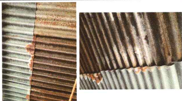
Foto1: SUSTITUCION LAMINA TROQUELADA CALIBRE 26