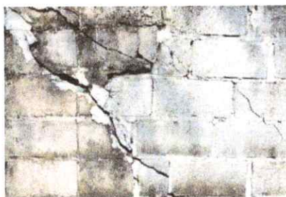
Foto 7: SUSTITUCION MURO PERIMETRAL BLOCK CISADO, SOLERAS Y COLUMNAS TALLADAS

Observación: Si es necesario se pueden agregar hojas adicionales y actualizar el número de hojas.