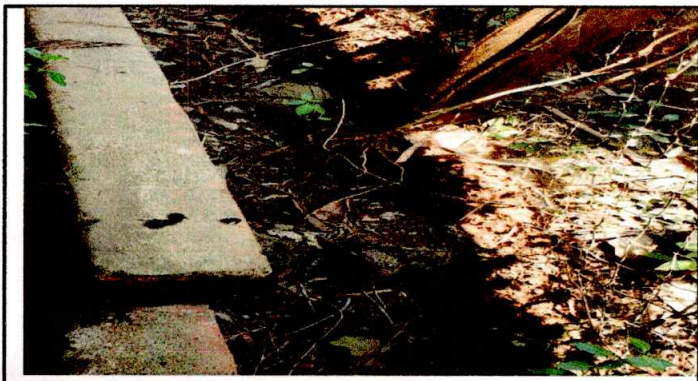
Foto3: CUNETA DE CONCRETO