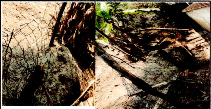
Foto: 6 CERCO O MURO PERIMETRAL

Observación: Si es necesario se pueden agregar hojas adicionales y actualizar el número de hojas.