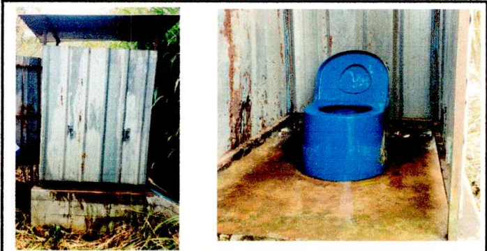
Foto: 5 SERVICIOS SANITARIOS Y SUS ACCESORIOS