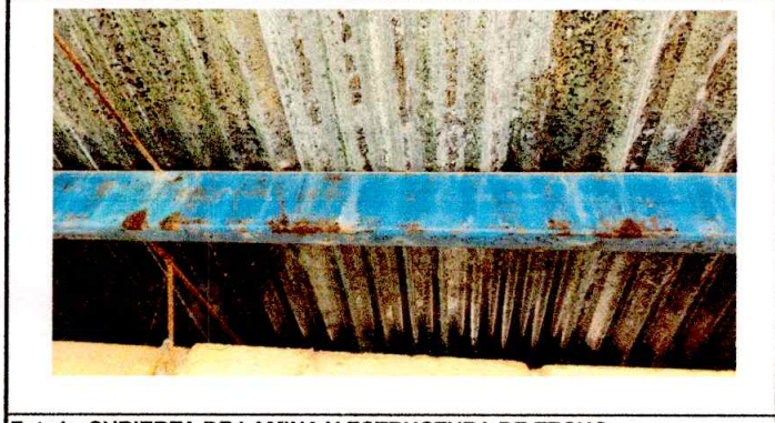
Foto1: CUBIERTA DE LAMINA Y ESTRUCTURA DE TECHO