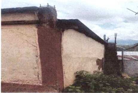
Foto1: Sustitución de pintura de aceite