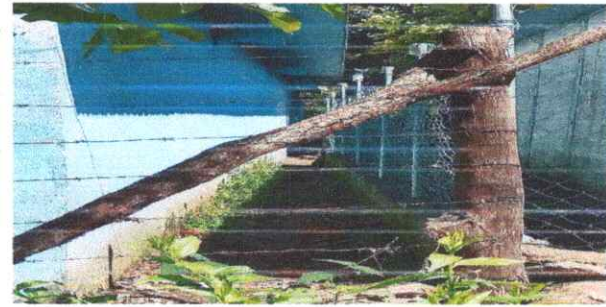
Foto 6: SUSTITUCION DE CERCO PERIMETRAL CON MALLA Y DOS HILADA DE BLOCK

Observación: Si es necesario se pueden agregar hojas adicionales y actualizar el número de hojas.