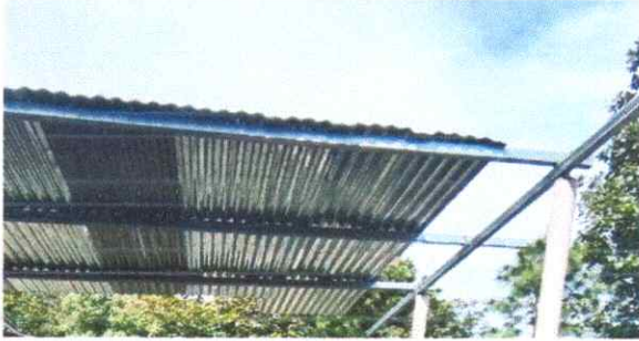
Foto1: SUSTITUCION DE LAMINA TROQUELADA (calibre26)