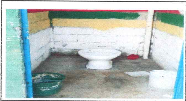
Foto1: SUSTITUCION DE SERVICIO SANITARIO COMPLETO (INCLUYE CONTRA LLAVE)