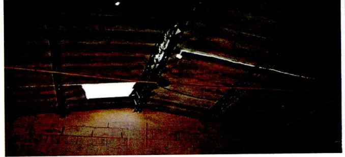
Foto 2: Reforzamiento de la estructura y cambio de la cubierta de lamina