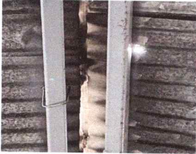
Foto 1: Sustitucion de lamina existente (troquelada calibre No. 26)