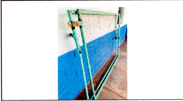
Foto3: Portón deteriorado.