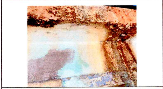
Foto4: Pintura en mal estado.