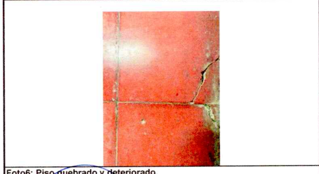
Foto6: Piso quebrado y deteriorado.

Observación: Si es necesario se pueden agregar hojas adicionales y actualizar el número de hojas.