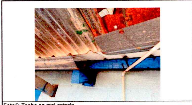
Foto5: Techo en mal estado.