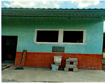
Foto1: Suministro e Instalación de lámina troquelada Aluzinc calibre 26 (incluye tornillos, capote)