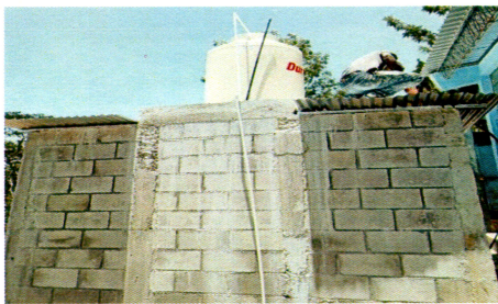
Foto 5: Sustitución de tinaco de 1100 litros incluye línea de distribución de agua y accesorios.