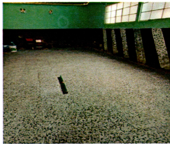
Foto 3: Suministro e instalación de piso de granito, Base para piso (plataforma)