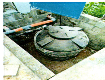
Foto 6: Sistema de drenaje de fosa séptica (Biodigester plastico) mas pozo de absorción (tradicional)

Observación: Si es necesario se pueden agregar hojas adicionales y actualizar el número de hojas.