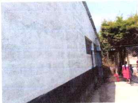
Foto: 5 Pintura para muros interiores y exteriores.