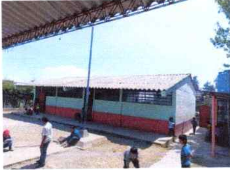
Foto1: Suministro e instalación de lámina troquelada calibre 26