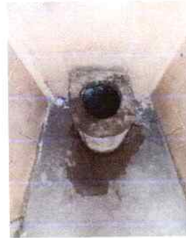
Foto4: Reparación de sanitarios.