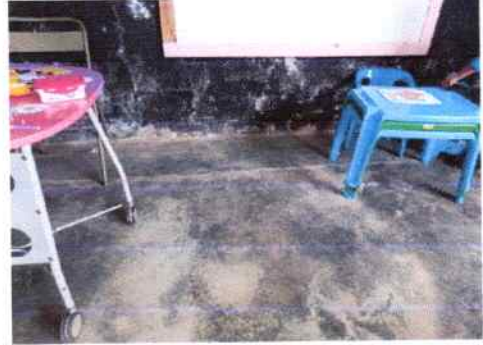
FOTO 2: Suministro e instalación de piso de granito en aula de primaria.