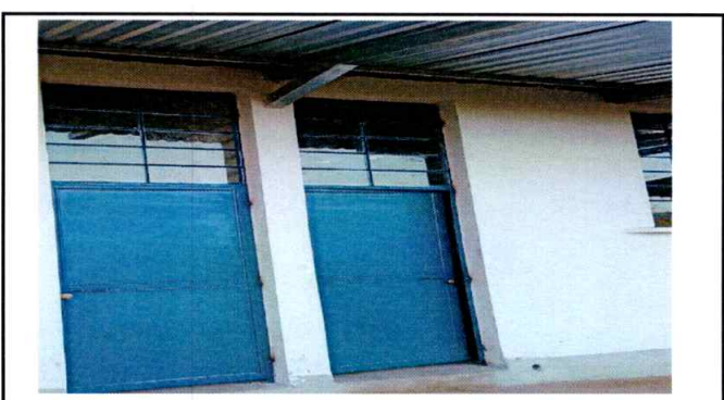
Foto 4: En esta fotografía se observan ya dos puertas colocadas y funcionales.