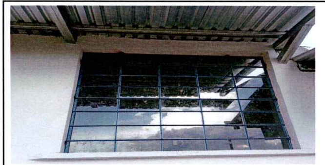
Foto 5: Se aprecia los ventanales ya finalizados con sus vidrios.