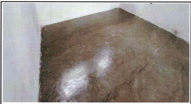
Foto 2: Se aprecia la torta o loza de patio ya finalizada utilizable al 100%