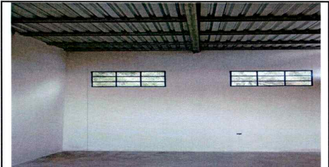
Foto 6: En esta fotografía podemos apreciar la estructura de techo colocada y utilizable para la cubierta de lámina.

Observación: Si es necesario se pueden agregar hojas adicionales y actualizar el número de hojas.