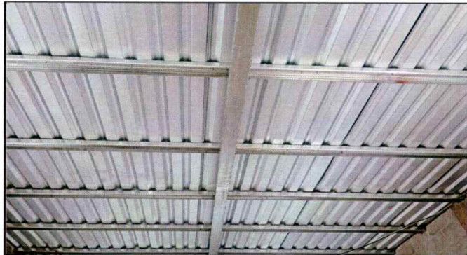
Foto1: Se observa la cubierta de lamina ya colocada funcional en su totalidad.