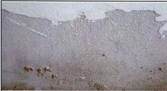
Foto 3: Aca se obserba el proceso de reparación de repello con sun base gis y blanqueado.