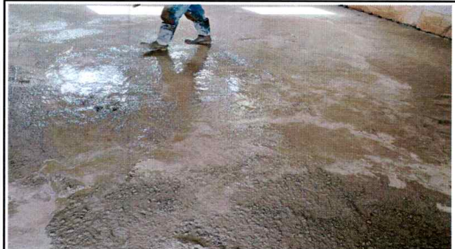
Foto 2: Se obserba el proceso de colocacion de la base de la loza de patio y/o torta.