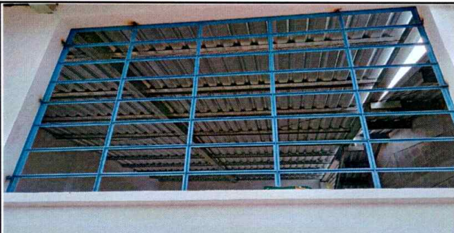
Foto 5: Aca se muestra el ventanal en su fase de colocación haciendo falta los vidrios.