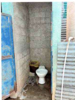
Foto5: SERVICIOS SANITARIOS Y SUS ACCESORIOS