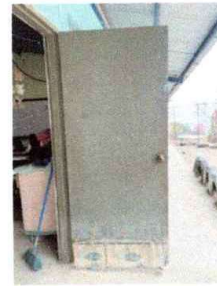
Foto4: PUERTAS (Reparación y Pintura)