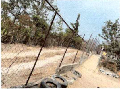
Foto1: MURO PERIMETRAL