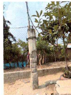
Foto6: REPARACION DE SISTEMA ELÉCTRICO

Observación: Si es necesario se pueden agregar hojas adicionales y actualizar el número de hojas.