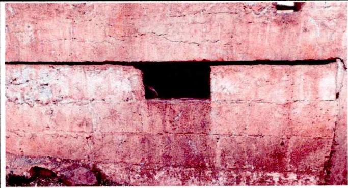
REPARACION Y SUSTITUCION DE PAREDES