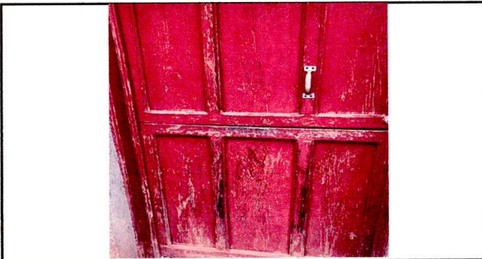
MANTENIMIENTO DE PUERTA Y REPARACION DE PINTURA