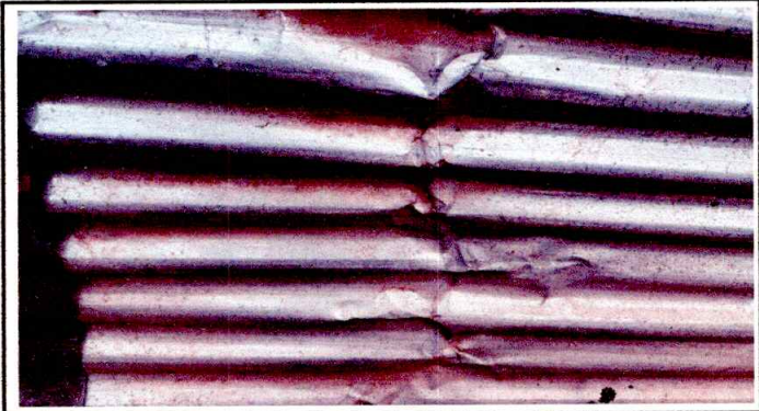
CUBIERTA DE LAMINA