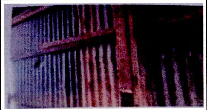
ESTRUCTURA DE TECHO