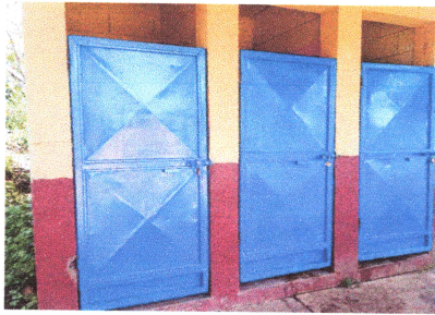
Foto1: reparacion y Pintado de puertas en sanitarios