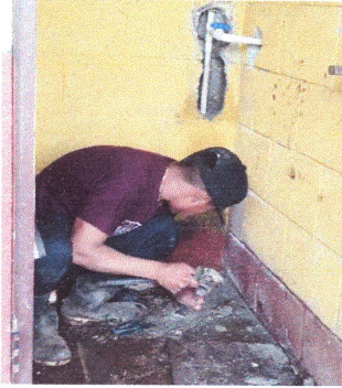
Foto1: Instalación de tubería de agua para sanitarios