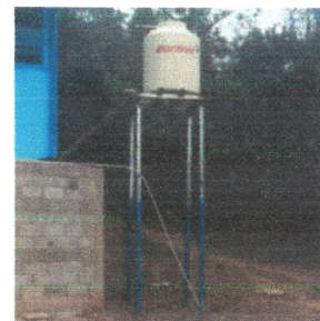
Foto: 5 Reparación de base para tinaco

Observación: Si es necesario se pueden agregar hojas adicionales y actualizar el número de hojas.