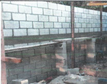
Foto: 5 Reparación de muro perimetral