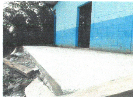
Foto4: Reparación de Losa en Patio