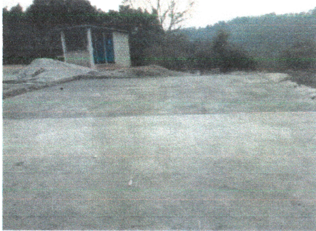
Foto3: Reparación de Losa en Patio