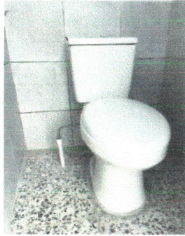
Foto1: Reparación de base de cemento para piso.