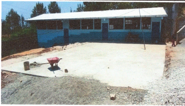
Foto3: Reparación de Losa en Patio