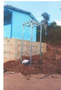
Foto: 5 Reparación de base para tinaco

Observación: Si es necesario se pueden agregar hojas adicionales y actualizar el número de hojas.