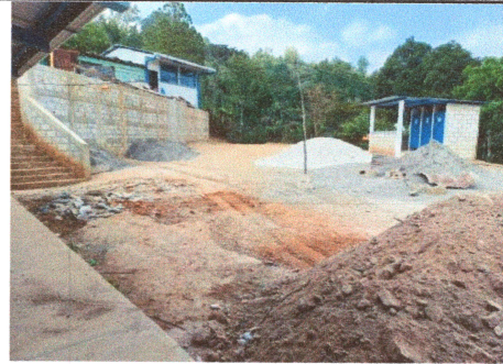
Foto4: Reparación de Losa en Patio