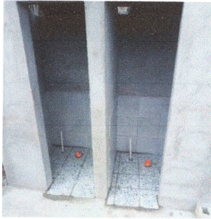
Foto1: Reparación de base de cemento para piso.