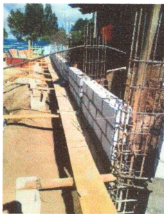
Foto 5 Reparación de muro perimetral