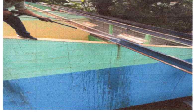
Foto 2: ESTRUCTURA DE TECHO MANTENIMIENTO LIJADA APLICACIÓN A DOS MANOS DE PINTURA ANTICORROSIVA