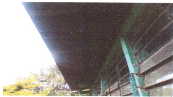
Foto 2: ESTRUCTURA DE TECHO (MANTENIMIENTO, LIJADA, APLICACIÓN A DOS MANOS DE PINTURA ANTICORROSIVA )