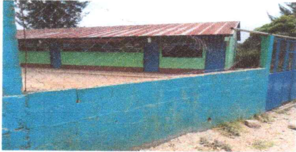
Foto 1: CUBIERTA DE LÁMINA (SUSTITUCION LÁMINA TROQUELADA CALIBRE 26 )