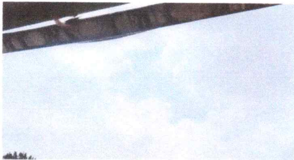
Foto 3: CANALES Y BAJADAS DE AGUA PLUVIAL (SUSTITUCION CANAL CUADRADO DE LÁMINA GALVANIZADA CALIBRE 13 )