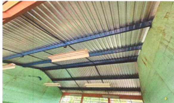
FOTO 2: ESTRUCTURA DE TECHO MANTENIMIENTO LIJADA APLICACIÓN A DOS MANOS DE PINTURA ANTICORROSIVA