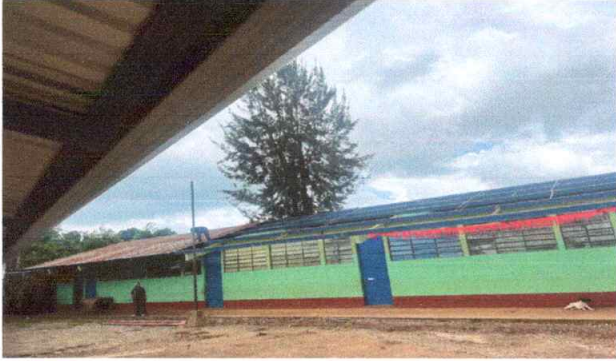
Foto1: CUBIERTA DE LÁMINA SUSTITUCION LAMINA TROQUELADA CALIBRE 26