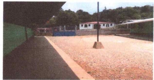
Foto 6: CUBIERTA DE LÁMINA (SUSTITUCION LÁMINA TROQUELADA CALIBRE 26 )

Observación: Si es necesario se pueden agregar hojas adicionales a continuación. Número de hojas.