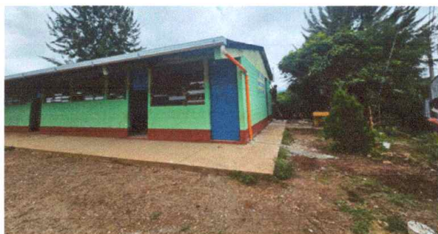
Foto 3 CANALES Y BAJADAS DE AGUA PLUVIAL, SUSTITUCION CANAL CUADRADO DE LAMINA GALVANIZADO CALIBRE 13