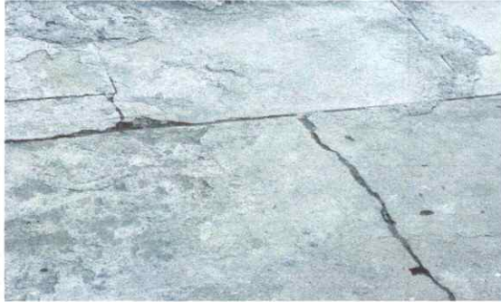
Foto1: DETERIORO DE TORTA DE CEMENTO