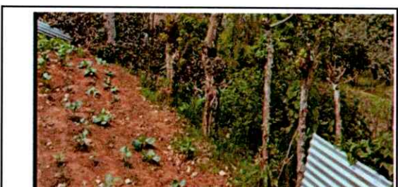
Foto 6: SUSTITUCION DE CERCO A MURO PERIMETRAL DE MALLA

Observación: Si es necesario se pueden agregar hojas adicionales y actualizar el número de hojas.