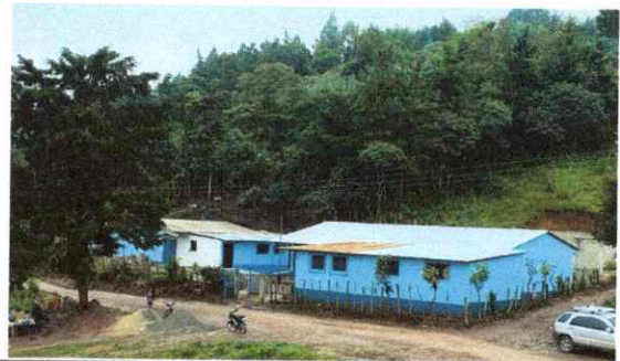
Foto 4: VISTA GENERAL ACTUAL DE LAS INSTALACIONES DEL ESTABLECIMIENTO.