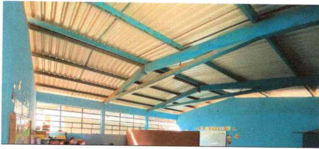
Foto1: MANTENIMIENTO DE ESTRUCTURA DE TECHO (PINTURA) PRESENTA OCCIDO Y TIENE GOTERAS.