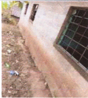
Foto3: Reparación de paredes de cocina