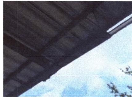
Foto4: Reparación de canal y bajada de agua pluvial