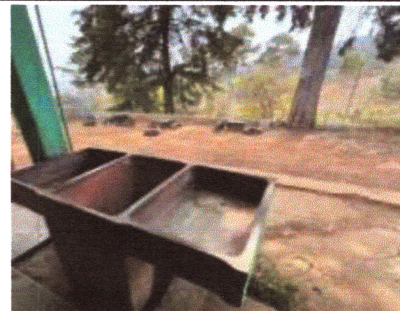
Foto: 6 Reparación de pila

Observación: Si es necesario se pueden agregar hojas adicionales y actualizar el número de hojas.