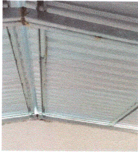
Foto1: Instalación de lámina Aluzinc calibre 26