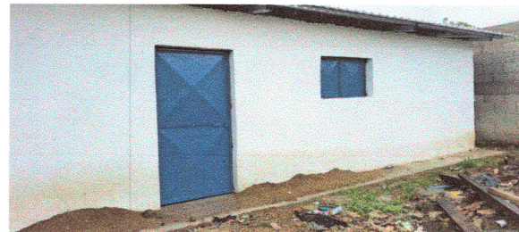
Foto: 6 Sustitución de puerta

Observación: Si es necesario se pueden agregar hojas adicionales y actualizar el número de hojas.