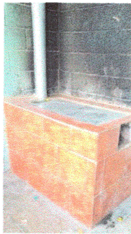
Foto3: Reparación de estufa rural