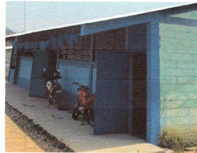
Foto4: Mantenimiento a puertas de metal lijado, cepillado, sujeciones, aplicación de 2 manos de pintura anticorrosiva)