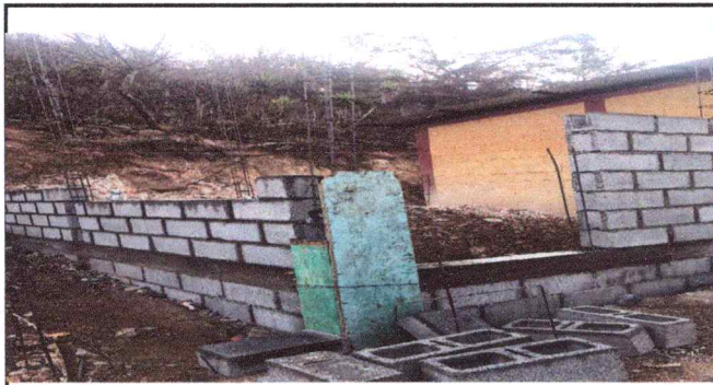
Foto3:REMOZAMIENTO DE COCINA