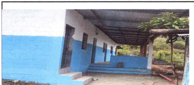
Foto: 5 REMOZAMIENTO DE SERVIO ELECTRICO Y PINTURA