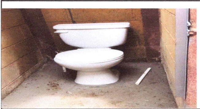
SEGUIMIENTO REMOZAMIENTO DE OUERTAS DE BAÑOS