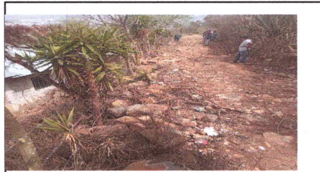
Foto4: REMOZAMIENTO DE CERCADO DE CENTRO EDUCATIVO