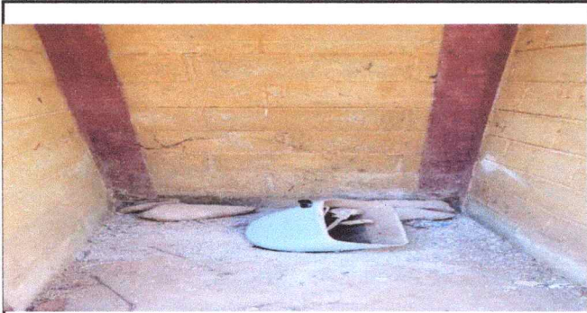
Foto3:REMOZAMIENTO DE BAÑOS