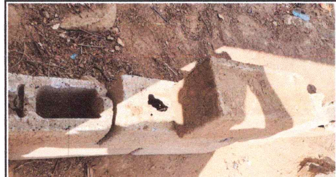
Foto4: REMOZAMIENTO DE COCINA