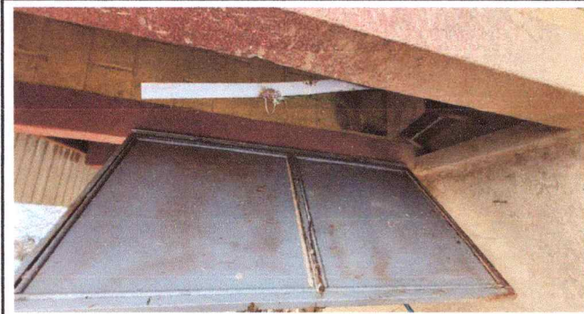
REMOZAMIENTO DE OUERTAS DE BAÑOS