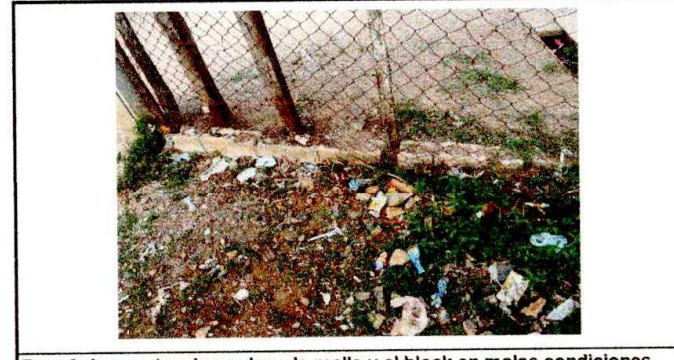
Foto 6: los postes de madera, la malla y el block en malas condiciones.

Observación: Si es necesario se pueden agregar hojas adicionales y actualizar el número de hojas.