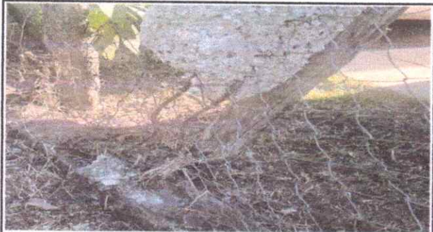
Foto1: INSTALACIÓN DE MALLA HEXAGONAL PARA MURO PERIMETRAL