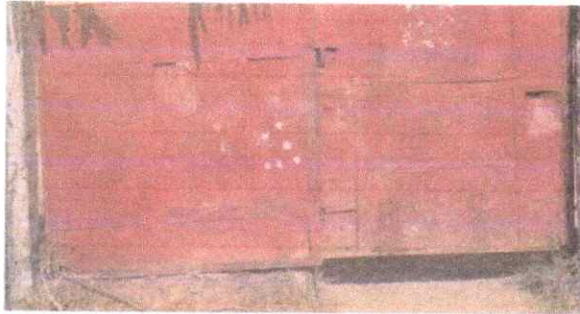
Foto1: REPARACIÓN Y MANTENIMIENTO A PORTON

Observación: Si es necesario se pueden agregar hojas adicionales y actualizar el número de hojas.