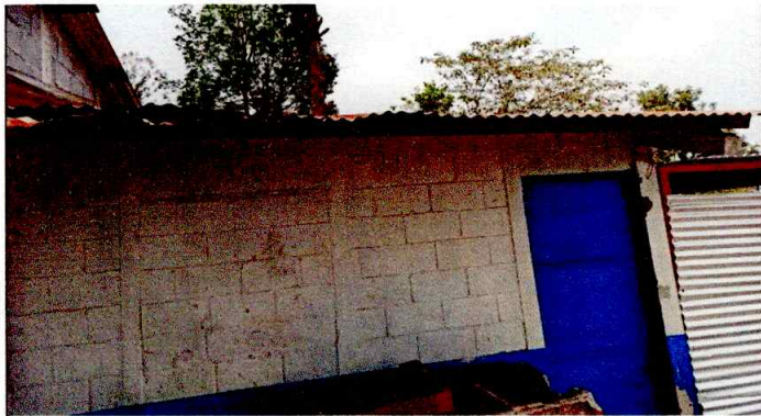
Foto 9: REPARACION O SUSTITUCION DE AREA DE COCINA (ESTUFAS RURALES, PILAS, VENTANAS, PUERTAS, CHIMENEAS, ETC.)