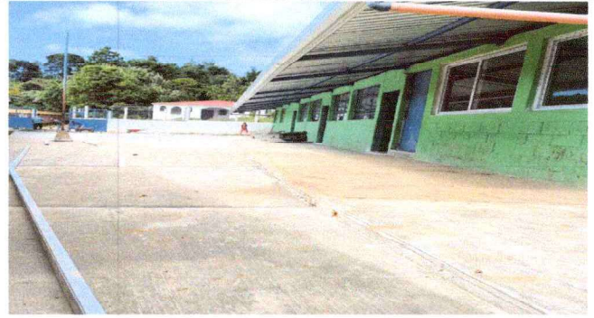
Foto 2: SUSTITUCIÓN LOSA DE PATIO INCLUYE FUNDICIÓN BASE Y ACABADO