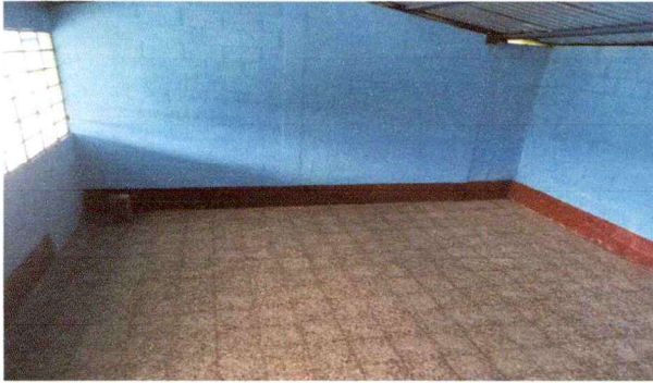
Foto1: SUSTITUCIÓN PISO DE GRANITO (INCLUYE BASE CON MEZCLÓN)