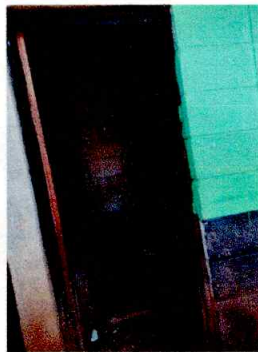
Foto3: REPARACIÓN DE SERVICIOSANITARIOS Y SUS ACCESORIOS, PINTURA