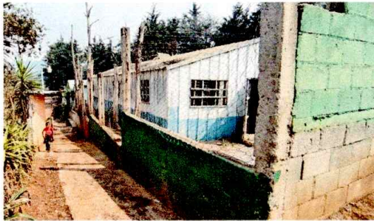
Foto1: REPARACION DE MURO PERIMETRAL