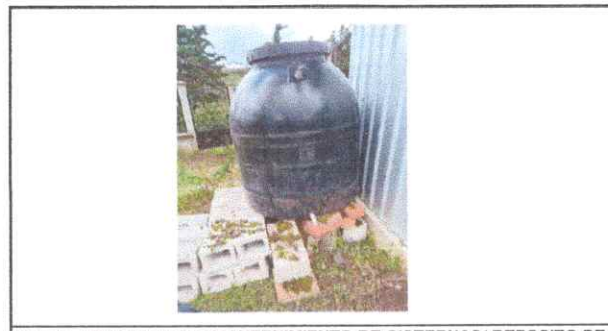
Foto 6: REPARACION Y MANTENIMIENTO DE CISTERNAS/ DEPOSITO DE AGUA

Observación: Si es necesario se pueden agregar hojas adicionales y actualizar el número de hojas.