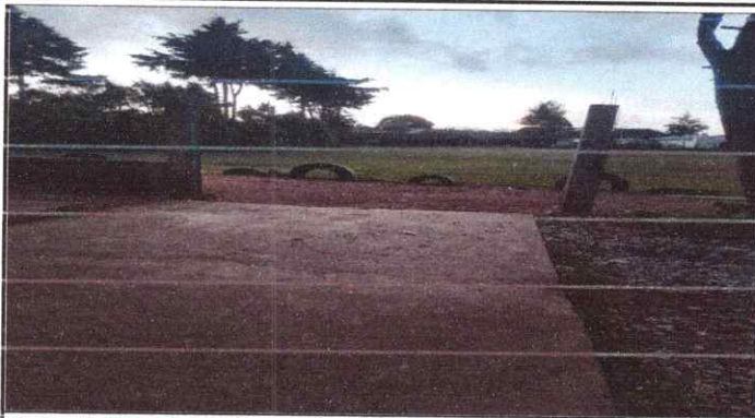
Mantenimiento de portón