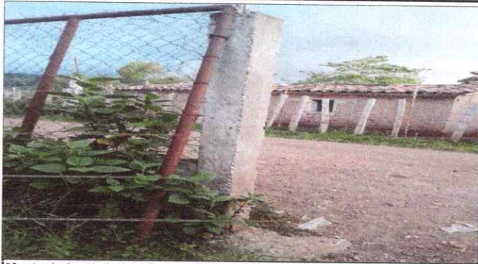
Mantenimiento de portón