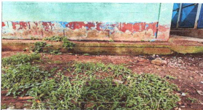
Pintura de pared