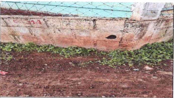
sustitucion de muro perimetral