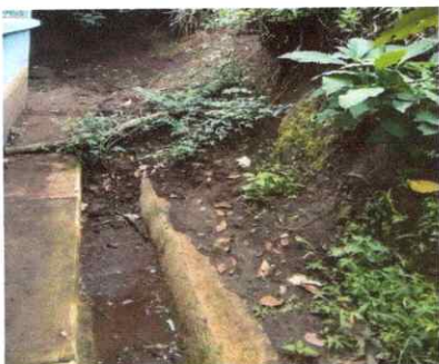
Foto 5: SUSTITUCION MURO PERIMETRAL BLOCK CISADO COLUMNAS DE CONCRETO SABIETA