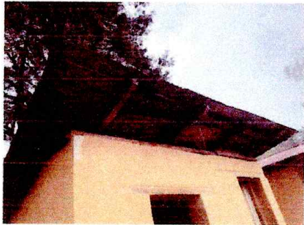
Foto1: REPARACIÓN DE TECHO