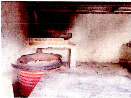
Foto3: INSTALACIÓN DE ESTUFA RURAL