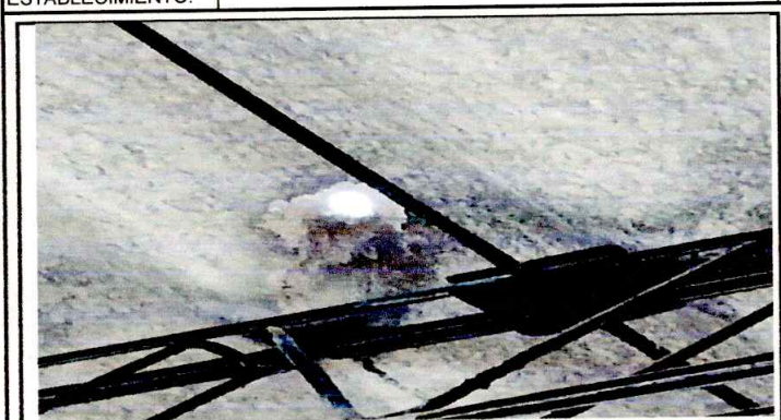
Foto 1: SE APRECIA FILTRACION DE AGUA A LAS AULAS Y REFUERZO EN JOIST