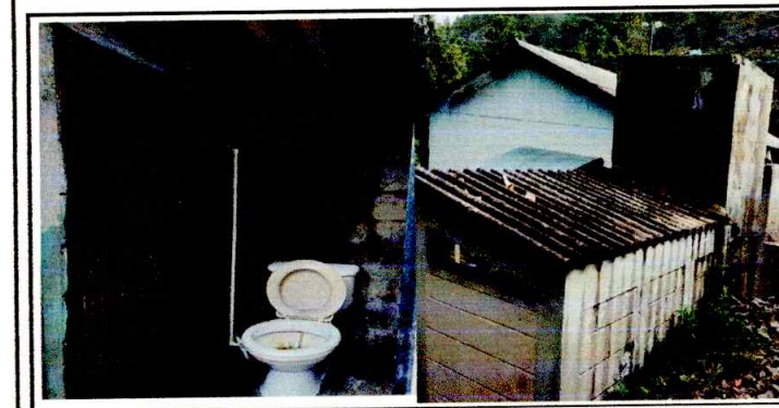
Foto 5: SERVICIOS SANITARIOS EN MAL ESTADO Y CON FILTRACION DE AGUA POR LAMINA DE FIBROCEMENTO QUEBRADA, DEPOSITO DE AGUA RAJADO