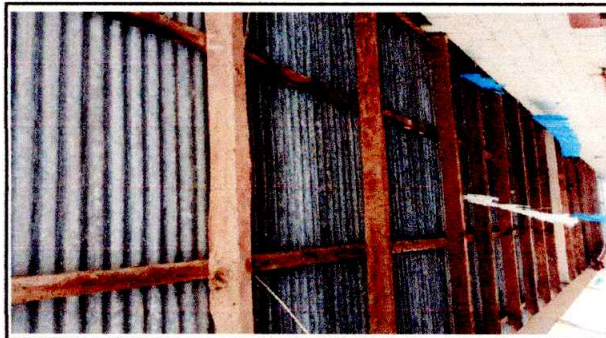
Foto: 2 Se necesita cambio de estructura de madera por estructura de metal, por presentar polilla