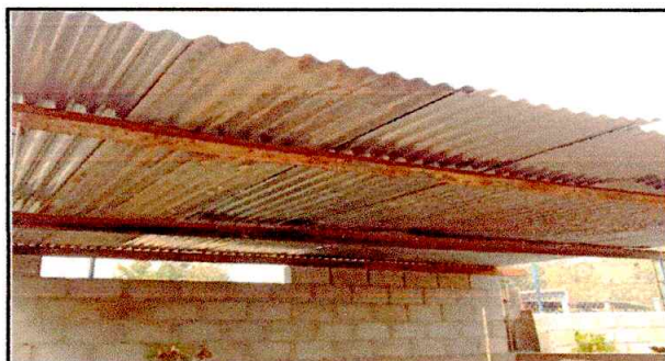
Foto: 6 Escenario, necesita sustitución de estructura de madera por estructura de costanera por tener daños y espacios muy prolongados entre vigas

Observación: Si es necesario se pueden agregar hojas adicionales y actualizar el número de hojas.