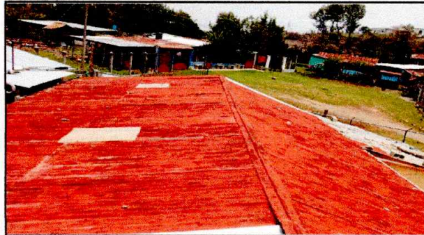
Foto: 1 Lamina presenta daños por antigüedad