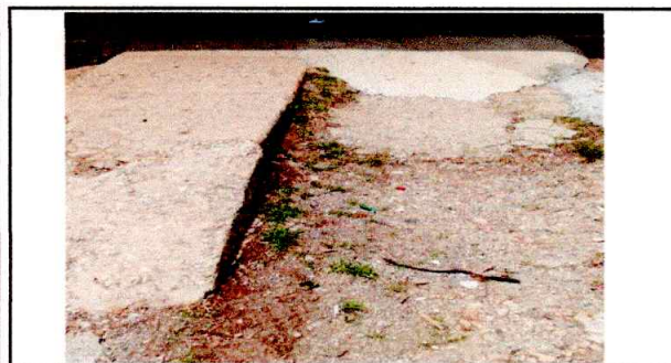
Foto: 5 Losa de patio quebrada, presenta varias añadiduras de concreto difícil acceso