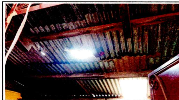
Foto: 3 Lamina rota con varios daños