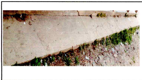
Foto: 4 Losa de patio agrietada