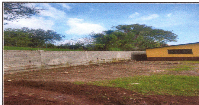
Foto: 5 Reparación de muro de contención