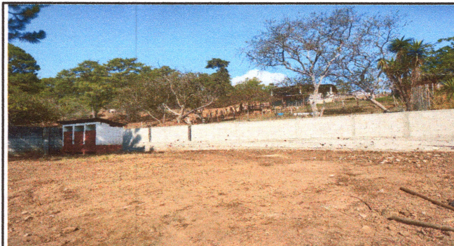
Foto4: suministro y reparación de muro de contención.