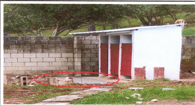
Foto3: Mantenimiento de fosa séptica.