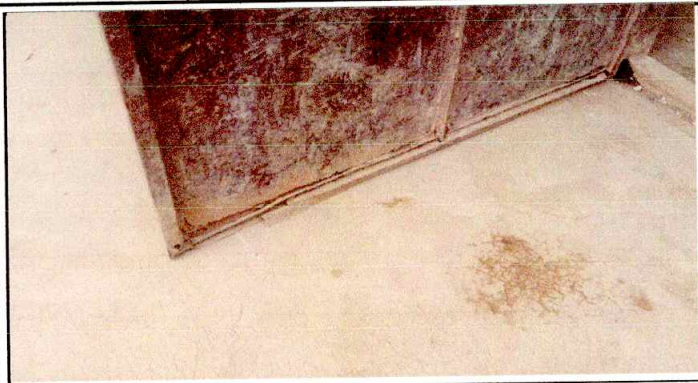
Foto1: SE OBSERVA PUERTAS EN MAL ESTADO