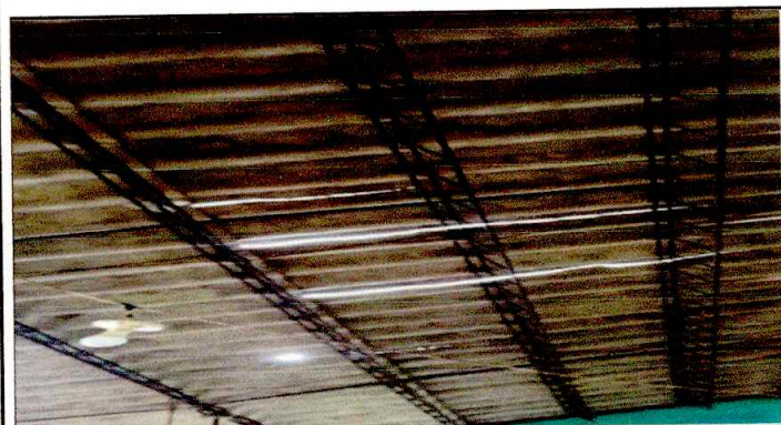
Foto3: Se observa techo de duralita en mal estado se producen filtraciones