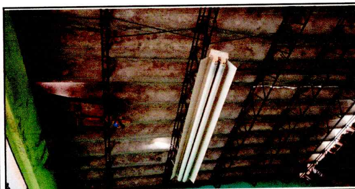
Foto: 5 estructura de lamina en mal estado