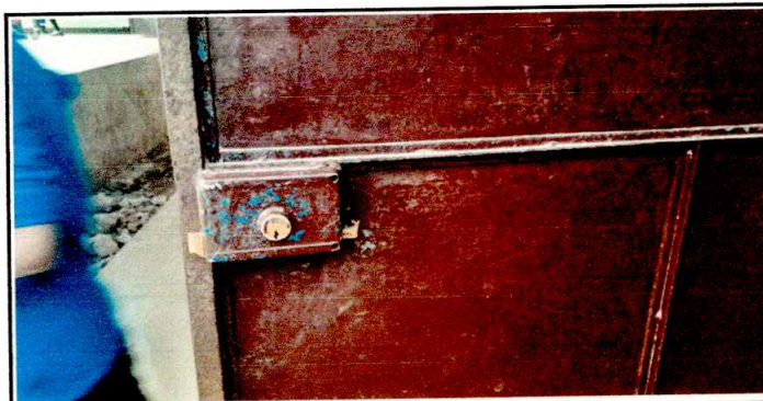
Foto: 6 Se observa chapas de puerta en mal estado

Observación: Si es necesario se pueden agregar hojas adicionales y actualizar el número de hojas.