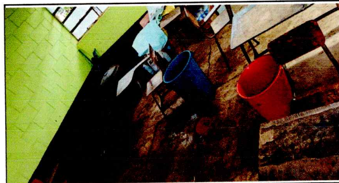
Foto4: Se observa filtracion de agua a las aulas