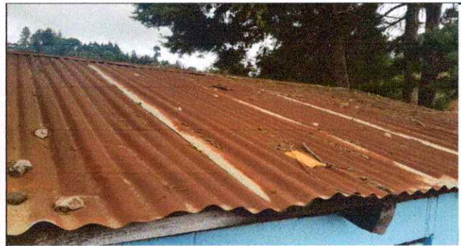
Foto1: SE OBSERVA LA LAMINA CON OXIDO