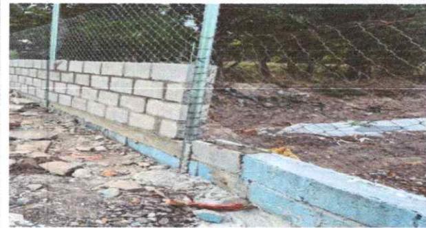
Foto 4: REPARACIÓN, AMPLIACIÓN Y SUSTITUCIÓN DE MURO PERIMETRAL Y MALLA.