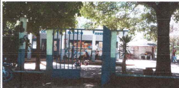
6. FOTOGRAFÍA DE LA VISTA GENERAL DEL ESTABLECIMIENTO.

Observación: Si es necesario se pueden agregar hojas adicionales y actualizar el número de hojas.