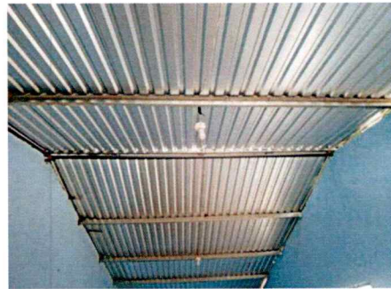
Foto4: REPARACIÓN DE TECHO