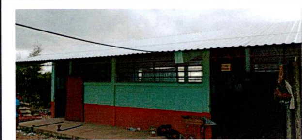
Foto1: REPARACIÓN DE TECHO