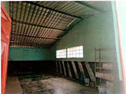
Foto3: REPARACIÓN DE TECHO