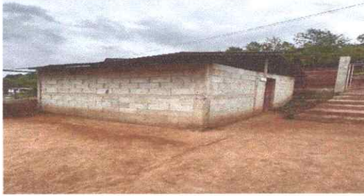
Foto1: SUSTITUCION LAMINA CALIBRE 26 MM