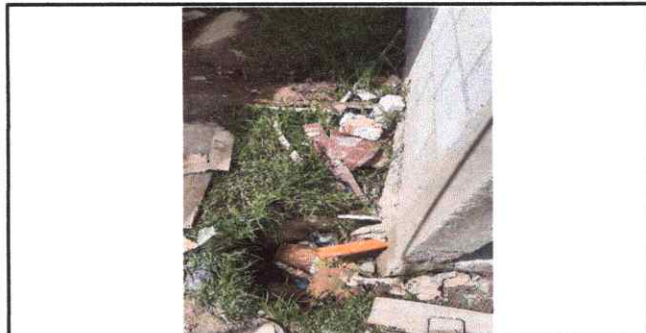
Foto 5: Se evidencia tubería de agua y drenaje en malas condiciones.