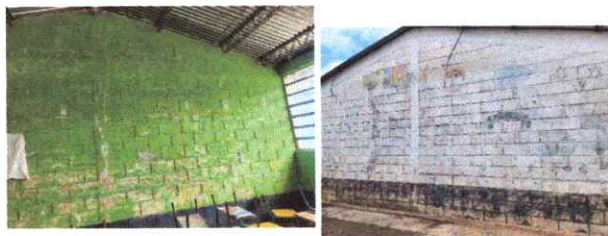
Foto 14: pintura de interiores y exteriores en malas condiciones.