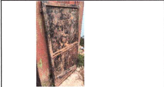
Foto1: Puerta de baño en mal estado