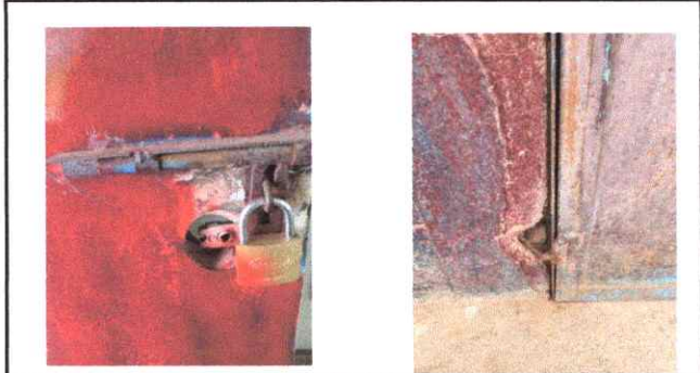
Foto 2: Chapa, marcos y pintura de puertas de aula en mal estado.