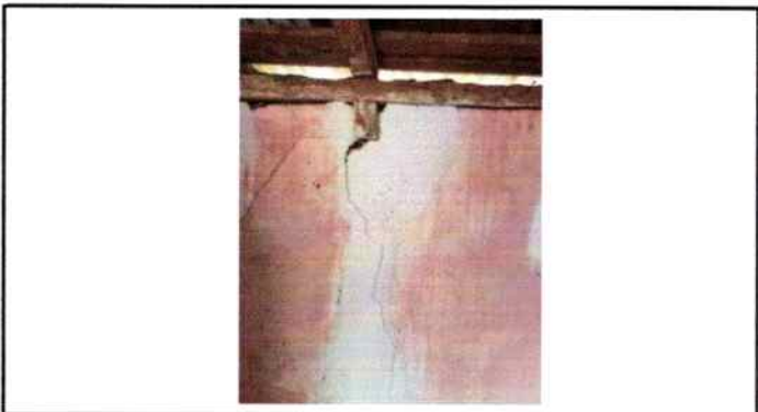
Foto4: Pared en mal estado.