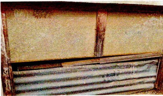
Foto3: SE PUEDE OBSERVAR VENTANA DETERIORADA