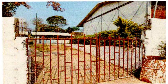
Foto4: SE PUEDE OBSERVAR DETERIORO DE PORTON