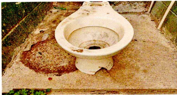
Foto: 5 SE PUEDE OBSERVAR SANITARIO DAÑADO