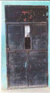
Foto3: PUERTA (Reparación y pintura)