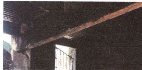
Foto4:CUBIERTA DE LAMINA