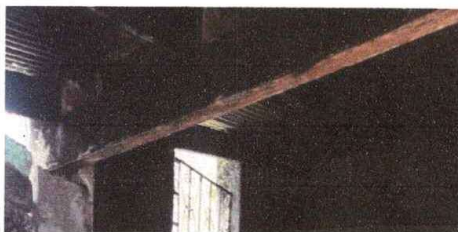
Foto5:ESTRUCTURA DE TECHO

Observación: Si es necesario se pueden agregar hojas adicionales y actualizar el número de hojas.