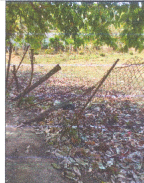
Foto 4: Maya de circulación de perímetro del establecimiento en malas condiciones.