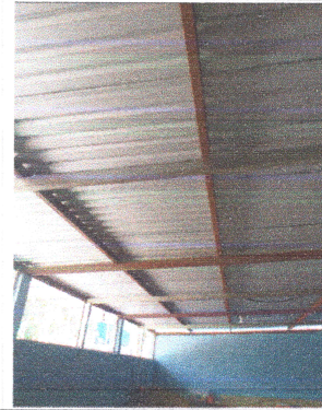
Foto 2: FINALIZACIÓN DE INSTALACIÓN DE TECHO O CUBIERTA EN SALÓN DE CLASES.