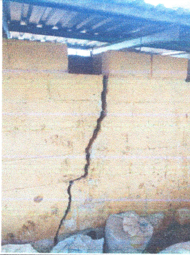
Foto1: Pared de sanitarios en mal estado.