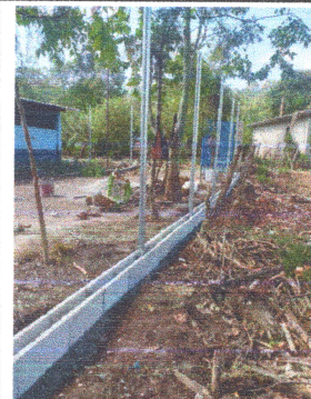
Foto 4: INSTALACIÓN DE MURO PERIMETRAL CON BASE DE BLOCK E INSTALACIÓN DE MAYA.