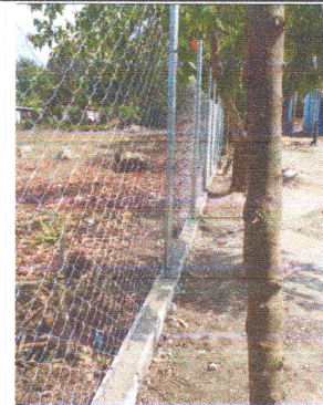
Foto 4: FINALIZACIÓN DE CIRCULACIÓN DE PERÍMETRO CON MAYA Y BASE DE BLOCK.