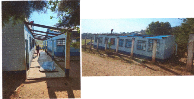
Foto1: Cambio de Lámina